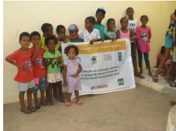
Crianças das comunidades do Norte