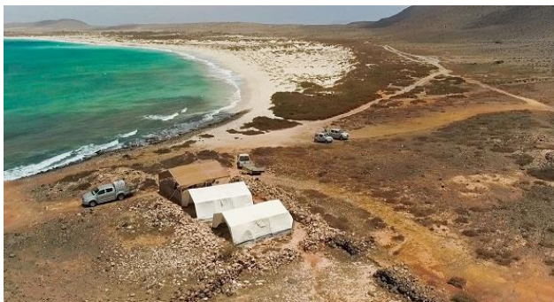
Acampamento do Norte - "Fotografia do Drone"

Essa nova temporada de 2017 começou mais cedo, o primeiro acampamento a ser montado foi no Norte, na Praia de Canto no primeiro dia de Junho. A logística de montagem não é fácil, estruturas das tendas para dormir, a grande tenda da cozinha, bancos, mesas, todo o material de