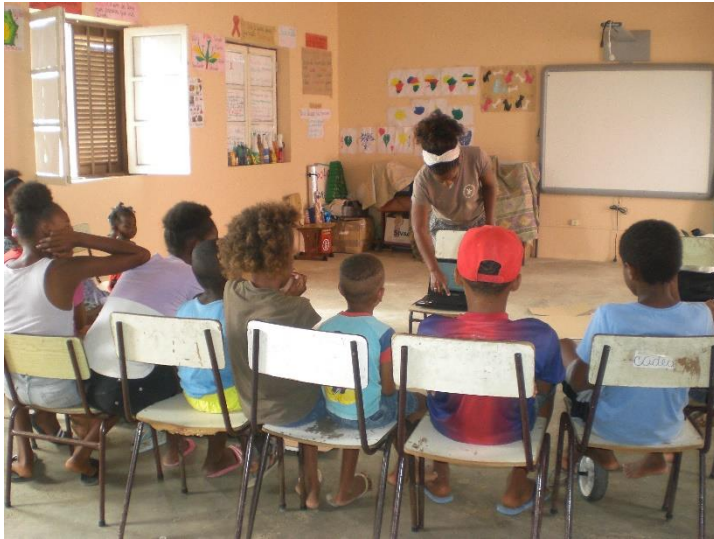
Aula sobre a vida das tartarugas

Proteger as tartarugas marinhas e os seus habitats