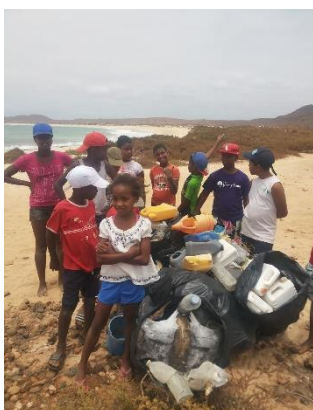
Recolha de lixo feita pelas crianças

as novas gerações aprendam sobre proteção e preservação da rica biodiversidade que Cabo Verde ainda possui. O primeiro evento ocorreu no acampamento do Norte, na Praia de Canto, nos dias 17 e 18 de Junho, com crianças de diferentes faixas etárias, das comunidades de João Galego, Fundo das Figueiras e Cabeça dos Tarrafes. Foram desenvolvidas diferentes atividades, desde apresentações sobre as tartarugas marinhas, a limpeza das praias e trabalhos manuais. Também foram realizados eventos dentro das comunidades com a projeção do filme “A Viagem da Tartaruga” que mostra e ensina o ciclo de vida da tartaruga cabeçuda. Esses eventos envolvem uma logística nada simples e requer bastante organização e compromisso.