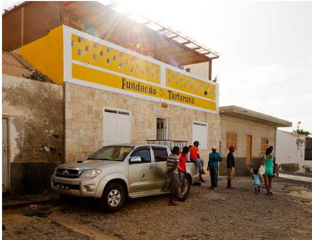
Fachada do escritório (Sal Rei)

Mais uma temporada se inicia, uma temporada de extrema importância, cheia de novos desafios, com novas ideias, novos projetos, novas pessoas e parcerias.. Para nós, da Fundação Tartaruga, o mês de Junho é definitivamente um dos meses com maior importância do ano, com muitos acontecimentos em simultâneo. Em primeiro lugar com a chegada de um tal contentor, que levam os nervos à flor da pele, de alguns