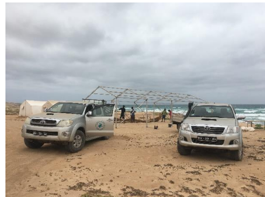
Início da montagem da Boa Esperança