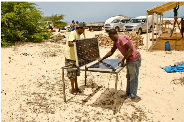
Preparando os painéis solares

filhotes, inclusive algumas fêmeas adultas nidificantes. O dia 15 de Junho foi a vez do acampamento da Boa Esperança, uma praia com a vista para um navio naufragado, o Santa Maria, um dos pontos turísticos mais visitados da ilha. Os outros dois acampamentos em Cruz Morto e Curral Velho são anexos dos acampamentos do Norte e Lacacão respectivamente, são um pouco menores de tamanho, mas sua importância é similar a dos acampamentos principais. Esses dois novos acampamentos estão estrategicamente montados em locais de maior risco de apanha. É uma das novidades para essa temporada que se inicia, e esperamos todos ter bons resultados com essa nova estratégia. Todos os 5 acampamentos estão devidamente em seu lugar, todos com suas sombras e cozinha montadas. Paineis solares a postos para receber as novas geladeiras que vieram no contentor, substituindo as antigas a gás, esperamos que as baterias aguentem. Os coordenadores de todos os acampamento vão arrumar os últimos detalhes junto com a sua equipe de rangers e voluntários, nacionais e internacionais. No acampamento do Norte são apenas Cabo Verdianos, uma vez que é uma zona de maior conflito e entender a língua local é primordial para se trabalhar tão perto das comunidades. Os voluntários internacionais já começaram a chegar, de diversas partes do mundo, até o momento da Argentina, Inglaterra, Portugal, Espanha, Alemanha, Itália, Polônia e esperamos muitos outros, que irão compor as equipes da Boa Esperança e do Lacacão.