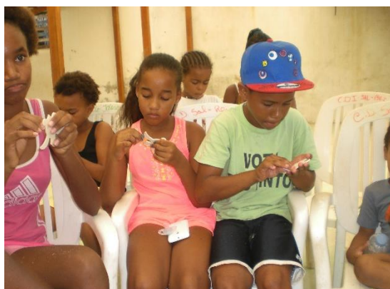
Artesanato com tartaruginhas de madeira