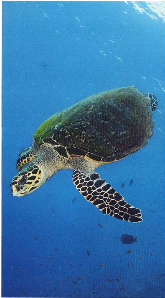
Eine verbliebene Population der Echten Karettschildkröte ( Eretmochelys imbricata ) bevölkert die Gewässer Indonesiens.

Die Kampagne zielt in erster Linie auf eine emotionale Ansprache der potenziellen KäuferInnen ab. Dies reicht von der Offenlegung der Grausamkeit der Gewinnung von Schildpatt (noch lebende Schildkröten werden mit kochendem Wasser überbrüht, damit die Hornschuppen sich leichter vom Knochenpanzer abziehen lassen) bis hin zu den positiven Effekten für den Schildkröten- und Meeresschutz, wenn man «cool ohne Schildpatt» ist. Als sympathischer Begleiter der Kampagne (und seither auch Maskottchen der Turtle Foundation) wurde «Kimi» geschaffen, eine junge Comic-Karettschildkröte. Kimi ziert das Informationsmaterial, das