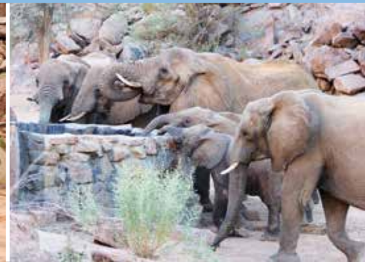
Die Artenschützer bauten Wasserstellen für die Wüstenelefanten

sehr gefreut. Im Wüstengebiet ist die Freude über Regen normalerweise groß – bringt er doch Leben, wo sonst nur Dürre herrscht. Allerdings fiel mit einer Regenmenge von 0 innerhalb weniger Stunden mehr Regen als ansonsten im Jahresdurchschnitt. Innerhalb von 5 Tagen waren es sogar 210 mm. Die letzten 8 Jahre fiel in dieser Gegend nur knapp 80 mm Regen pro Jahr! Nun fiel sogar so viel Regen, dass ein Nebenfluss des Ugab, der seit 12 Jahren kein Wasser mehr geführt hatte, zusätzliche Wassermassen in den Ugab leitete, so dass sich eine 3 m hohe Flutwelle durchs Basislager ergoss. Glücklicherweise wurde niemand verletzt und die meisten Fahrzeuge und einige Ausrüstungsgegenstände konnten in Sicherheit gebracht werden. Trotzdem ist der Schaden immens und erschwert die wichtige Arbeit zum Schutz der Wüstenelefanten. Die AGA hat eine erste finanzielle Nothilfe bereitgestellt und mit viel Tatkraft wurde bereits mit den Aufräumarbeiten begonnen. Das Basislager soll so schnell wie möglich wieder aufgebaut werden.