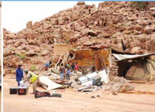
Kaum hatte der Regen nachgelassen, begannen die Aufräumarbeiten