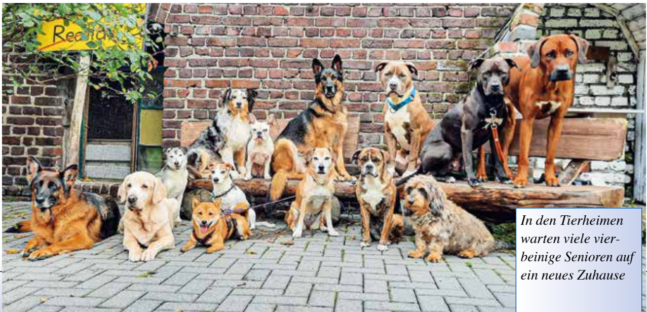
In den Tierheimen warten viele vierbeinige Senioren auf ein neues Zuhause

Wer im Alter allein geblieben ist, wird sich durch den Einzug eines Tierheimhundes nicht einsam und verlassen fühlen, sondern durch die regelmäßigen Gassirunden mit anderen Hundefreunden ins Gespräch kommen und automatisch menschlichen Kontakt pflegen. Die Betreuung und Pflege eines Hundes macht zufrieden und gibt älteren Menschen das Gefühl, eine Aufgabe zu haben und noch gebraucht zu werden. Haustiere fordern Zeit und Zuneigung von ihren menschlichen Partnern, so dass für eine feste Struktur und Prägung des Tagesablaufes gesorgt ist, was wiederum für Mobilität auf beiden Seiten sorgt. Hunde sind auch Balsam für die Seele, nämlich ideale Ansprechpartner, weil sie geduldig zuhören,