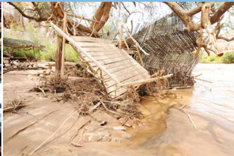
Die Fluten haben Alles verwüstet

Innerhalb kürzester Zeit war der Trockenfluss Ugab über die Ufer getreten. Das gesamte Tal wurde überflutet und das Basislager zum größten Teil zerstört. Die Wucht der Flutwelle war gewaltig. Zwei Mitarbeiter konnten sich gerade noch in Sicherheit bringen, als das stabile Steinhaus, das als Aufenthaltsraum diente, zusammenstürzte, nachdem die Flutwelle das Fundament ausgehöhlt hatte.