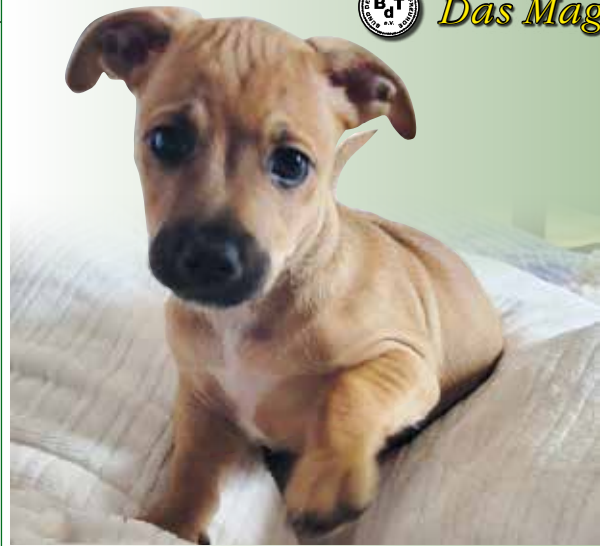
Die Kleinen erobern das Leben

Erst vier Tage später blinzelte Brummer auf dem rechten Auge und brummte natürlich dazu, was zur Namensgebung führte. Quicker folgte mit dem linken Auge und sogar das kleine Rippchen hatte am gleichen Abend einen fast unsichtbaren Schlitz an den Augen. So ging es eine Woche weiter vorwärts. Die Aktivität der Welpen ging schon in eine erfreuliche Richtung. Deutlich reger wurde nun das Bettchen erkundet und die ersten typischen Hundegesten gesichtet. Als die Welpen vier Wo-