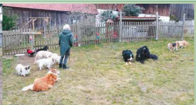
Sechs kranke Hunde als Neuankömmlinge