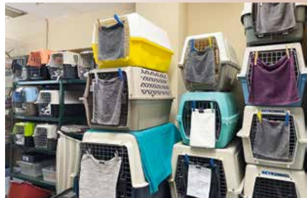
Die Rettungsstation ist voll mit tierischen Patienten