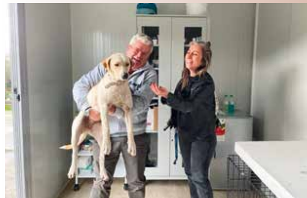
Ein verletzter Streuner in der Rettungsstation