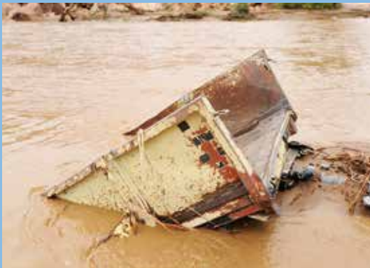
Auch Fahrzeuge wurden von den Fluten mitgerissen