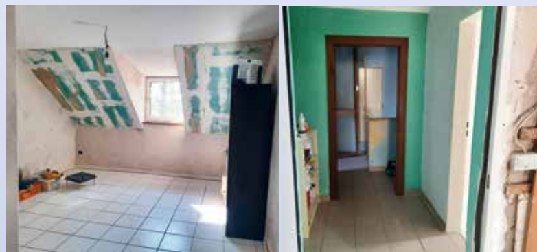
Die Räume sollen tiergerecht werden

Wer dabei helfen möchte, noch vielen weiteren in Not geratenen Tieren eine vorübergehende oder endgültige Bleibe zu bieten, kann sich sehr gern beim BDT-Team melden. Benötigt werden Sachspenden bzw. entsprechende Baumaterialien wie Fliesen, Deckenpanelen, Deckenbeleuchtung, Zu- und Abwasserleitungen, neue Türen etc. Aber direkte Mithilfe durch einen erfahrenen Fliesenleger zum Beispiel würde ebenfalls sehr helfen.