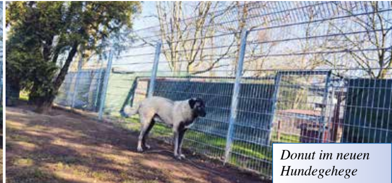
Donut im neuen Hundegehege