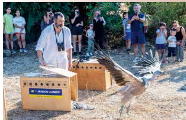
Ein Geier wurde wieder ausgewildert