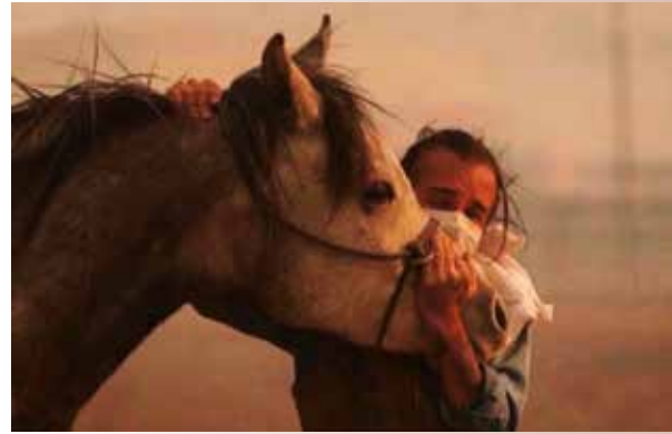
Ein Pferd in der Flammenhöhle des vergangenen Jahres