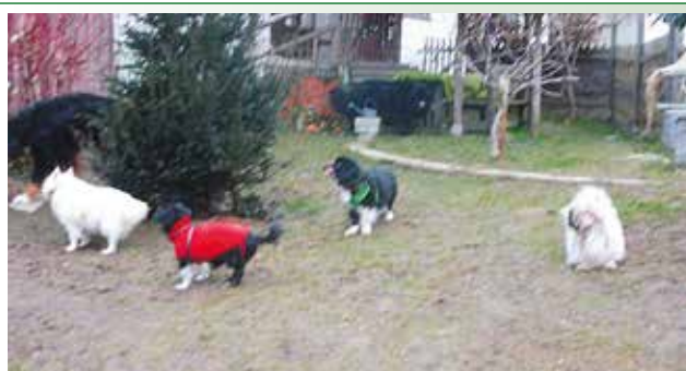
Teddy wird mit Pullover vor Kälte geschützt