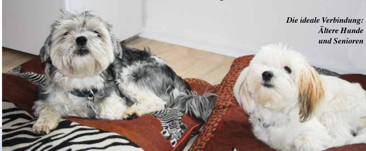
Die ideale Verbindung: Ältere Hunde und Senioren

Insgesamt gesehen sind Hunde ein Jungbrunnen für jeden älteren Tierfreund. Aber auch umgekehrt leben gerade ältere Hunde, die in Heimen gelandet sind, in einem neuen, liebevollen Zuhause nochmal richtig auf. Wissenschaftliche Studien besagen, dass der enge Kontakt zu einem Tier in Form von Streicheln oder verbaler Ansprache uns Menschen gut tut und beruhigend wirkt. Es stabilisiert den Blutdruck und baut Stress ab, weil dadurch Glückshormone freigesetzt werden. Tiere tun uns einfach gut und dass gerade Hunde mit ihrer unerschütterlichen Treue und Bodenständigkeit unsere besten Freunde sind, dürfte bekannt sein.