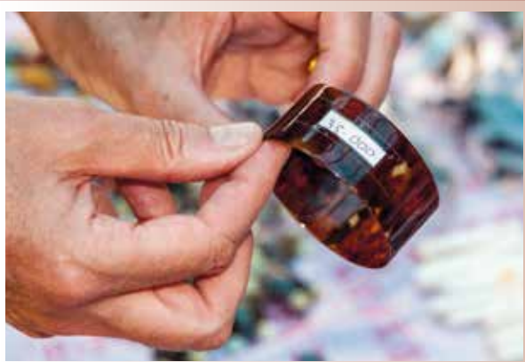
Armband aus Schildpatt für umgerechnet 2,20 Euro

Zu Beginn standen eine landesweite Medienkampagne und ein Aufruf zur Mitwirkung, mit dem Ziel, aktive Produktions- und Verkaufsstellen und nationale Handelsrouten für Schildpatt zu identifizieren. Der zweite Schritt zielte auf die Eindämmung dieser Aktivitäten durch Ansprache und gegebenenfalls polizeiliche Anzeige von Erzeugern und Vertreibern. Außerdem beinhaltete die Initiative die Durchführung von Aufklärungskampagnen in klassischen und sozialen Medien.