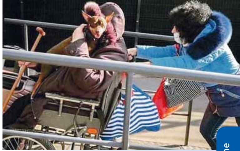
Mensch und Tier leiden in der Ukraine