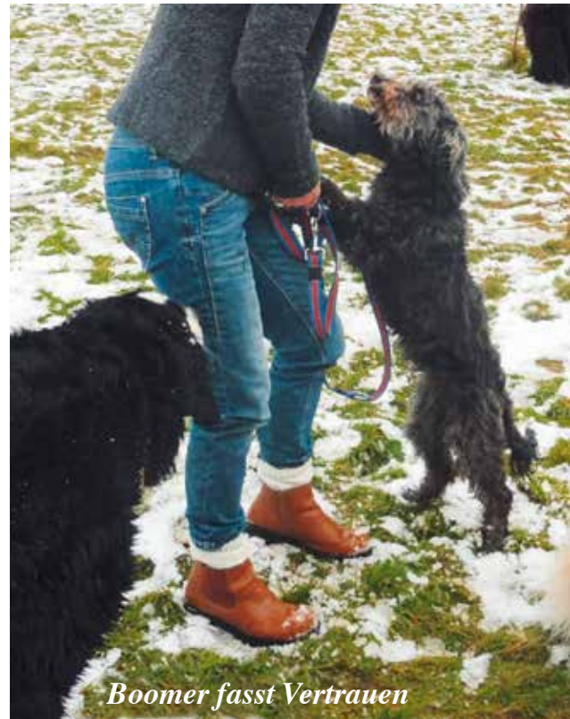
Boomer fasst Vertrauen

einäugig, zeigen sie langsam Neugierde und Vertrauen für ihre neue Welt. Mit viel Achtsamkeit und konsequentem, Vertrauen schaffenden Rahmen, beginnen die sechs Neuen zu erfahren, wie es sich anfühlt, in einem Körbchen im Haus zu schlafen, zu bestimmten Zeiten regelmäßig raus in den Garten zu gehen und Vertrauen zu seinen Menschen aufzubauen. So lernen sie als Mitglieder in der Hospizfamilie sozial mit ihren Artgenossen vertrauensvoll zu leben. Für die Herbergseltern ist es ein großer Aufwand, für die Neuankömmlinge den Rahmen zu schaffen, dass eine Routine entsteht, an der sich die Hunde orientieren können. Das baut Vertrauen auf und hilft den Hunden, sich in ihrer neuen Welt zu integrieren. Vor allem braucht es Zeit, die mit uns arbeitet, und so entfaltet sich für die armen Seelen ein Weg der Heilung in einem sicheren Zuhause und in Geborgenheit.“