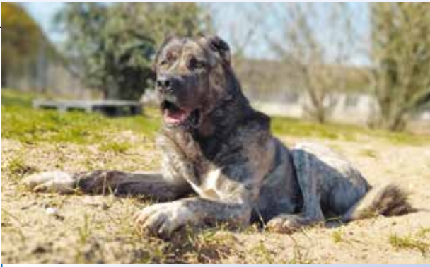
Auch Gulliver sucht ein neues Zuhause

GULLIVER der ebenfalls im Jahr 2018 geborene Rüde kam im Juni 2021 als Sicherstellung in die Tierherberge, da er nicht artgerecht gehalten wurde. Da er als Kettenhund gehalten wurde, hat er kaum etwas kennengelernt und war anfangs allem und jedem Neuen gegenüber extrem unsicher. Er nimmt seinen Job als Aufpasser von allen dreien am ernstesten. Neue Menschen werden deshalb erst mal heftig verbellt und gewarnt. Kennt er einen Menschen ist er eher ein übergroßes Baby und hat nur Flausen im Kopf. Das Spaziergehen gestaltet sich auch bei ihm schwierig, da er es wahrscheinlich nie gelernt hat und, ähnlich wie Donut, extrem an der Leine zieht. Andere Tiere (wie Katzen oder Kleintiere) werden von ihm nicht akzeptiert.