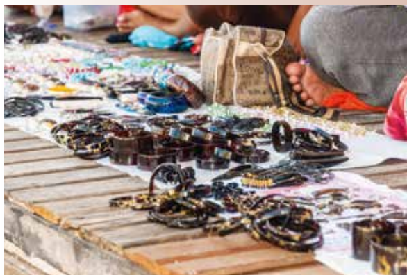
Schmuck aus Schildpatt auf einem Markt