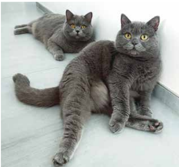
Glücklich vermittelt in ein neues Leben

Über mehrere Wochen wurden wir, mal von einem mal von beiden, regelmäßig besucht, bis endlich zu langersehnten Übernahme kam. Eigentlich waren unsere Dosenöffner gar nicht auf der Suche nach Haustieren, da es ihnen der Mietvertrag bisher auch