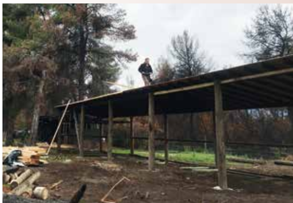
Zerstörte Stallungen wurden wieder aufgebaut

ben. So konnte beispielsweise in einem Container ein Behandlungszimmer eingerichtet werden, in dem auch weiterhin verletzte Wildtiere und Streuner versorgt werden. Auch Kastrationsaktionen, um die Schar verwilderter Hunde und Katzen einzudämmen, können dort durchgeführt werden. Während der