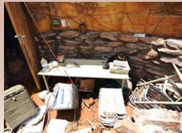
Das Basislager wurde zerstört

Hierfür bedanken wir uns herzlich im Voraus.