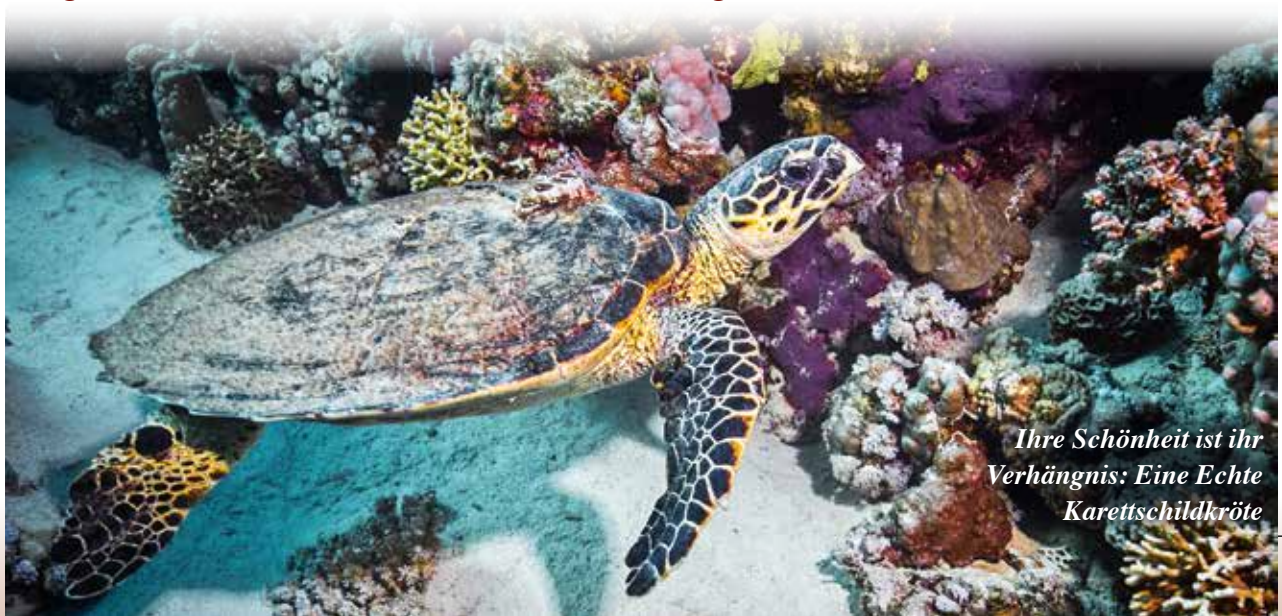
Ihre Schönheit ist ihr Verhängnis: Eine Echte Karettschildkröte

Ihre Schönheit wurde ihr zum Verhängnis: Die Echte Karettschildkröte ( Eretmochelys imbricata ) gilt wegen der attraktiv gemusterten Hornplatten auf ihrem Rückenpanzer als die schönste aller Meereschildkröten. Und genau diese Schuppen oder Hornplatten liefern leider auch einen begehrten Rohstoff – das sogenannte Schildpatt. Auch in Deutschland waren Kämme, Brillengestelle, Deko-Objekte und Schmuck aus Schildpatt früher weit verbreitet. Seitdem der internationale Handel mit Schildpatt im Jahr 1977 durch das Washingtoner Artenschutzabkommen CITES verboten wurde, dürfen solche Gegenstände nicht mehr aus- und eingeführt werden.