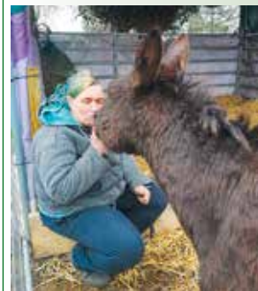
Die Tierpfleger kümmern sich um den Esel