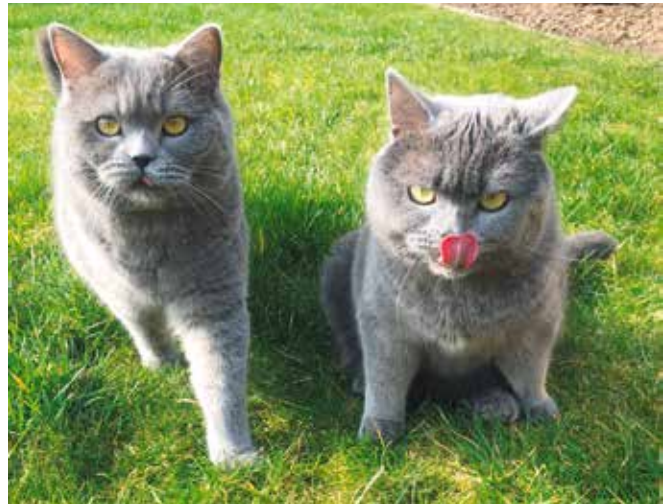
Die ehemaligen Tierheimbewohner genießen ihr Leben

verboten. Zu unserem großen Glück konnte die Vermieterin aber dann doch von den beiden überzeugt werden und so zogen wir am 11.02.2019 in unser Katzenparadies ein.