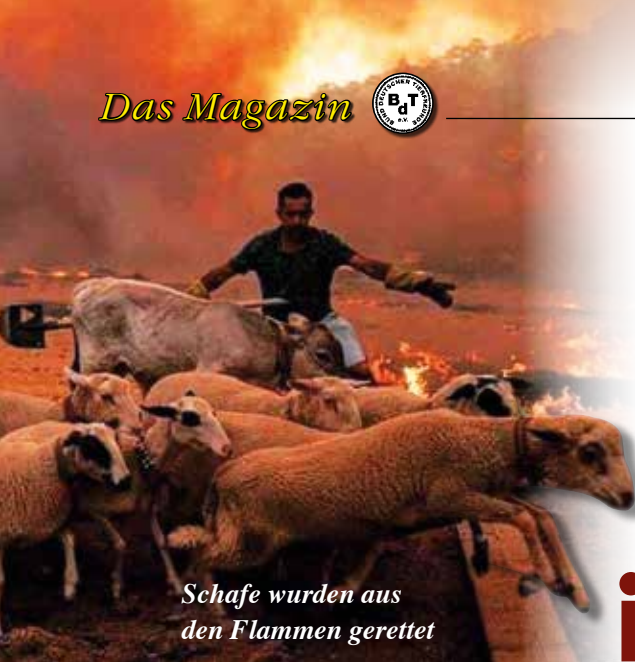
Schafe wurden aus den Flammen gerettet