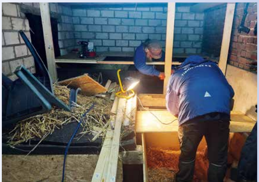
Die Bauarbeiten an Didis Heim