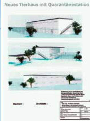
Die Baupläne zeigen die künftige Anlage

den Teile des alten Gebäudes abgerissen. Danach beginnen die eigentlichen Bauarbeiten. In der Planung ist ein modernes, helles zweistöckiges Gebäude für die Vierbeiner mit separaten Quarantänestationen für die Neuankömmlinge und gepflegten Außenbereichen für die Gruppenhaltung der Hunde. Die vielen Katzen sind in einem spezi-