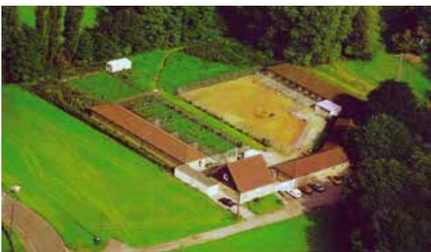
Wasserschäden und Feuchtigkeit haben dem alten Gebäude zugesetzt