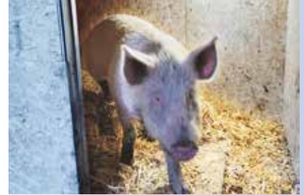
Schwein gehabt: Didi im neuen Heim

Dort finden Sie neueste Informationen, Hintergrundberichte und viele Adressen von unseren Partnern und Tierheimen, die Ihnen bei der Suche nach eine Haustier helfen.