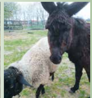
Mogli in seinem neuen Leben