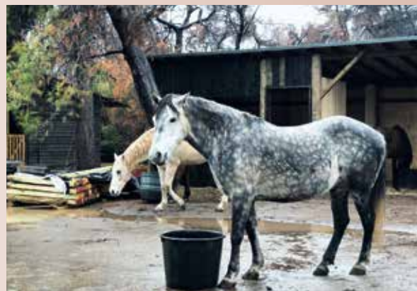
Gerettete Pferde vor dem neuen Stall