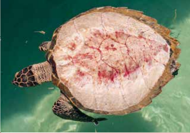
Eine Echte Karettschildkröte, der die Hornplatten grausam entfernt wurden

Kimis Appelle, die Schildkröten nicht grausam zu töten, um aus ihrem Schildpatt billigen Deko-Schmuck herzustellen, erreichten in Indonesien ein Millionenpublikum. In den sozialen Medien, sowie in Radio- und TV-Kanälen wurden die Kampagnenbeiträge von insgesamt mehr als 20 Millionen Menschen wahrgenommen. Den Erfolg der Kampagne hat die Turtle Foundation auch der sehr hohen Verbreitung sozialer Medien in Indonesien zu verdanken. Für die weitere Verbreitung der Botschaft bei den relevanten Zielgruppen startete die Turtle Foundation auf Bali den Aufbau eines Netzwerkes mit Gewerbetreibenden der Tourismusbranche.