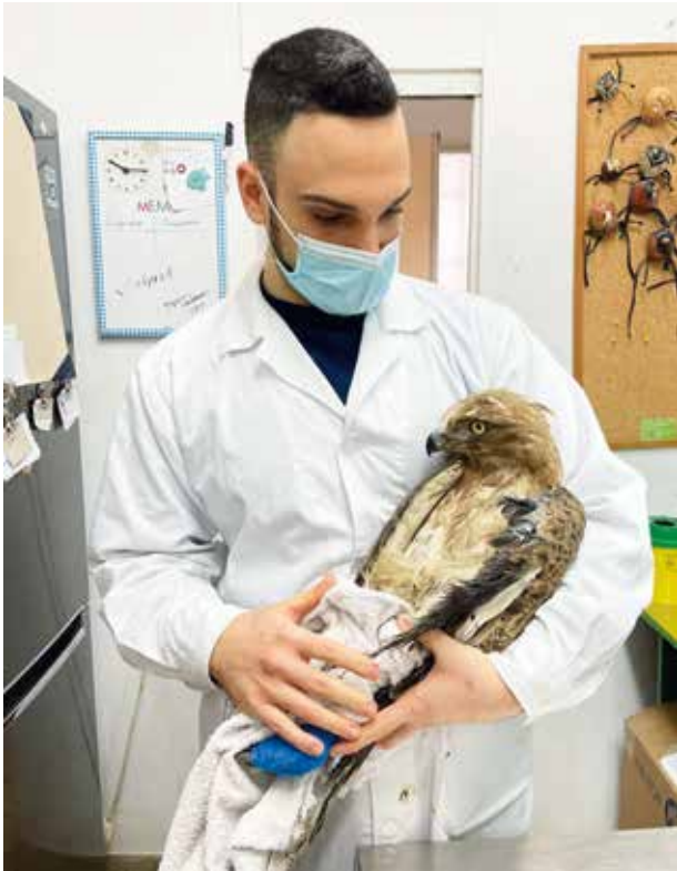
Ein Schlangenadler konnte gerettet werden

Waldbrände, war auf Euböa ein Gnadenhof für Pferde und Eseln den Flammen zum Opfer gefallen. Viele Tiere hatten schwere Verbrennungen und insbesondere schwere Verletzungen an den Hufen und Beinen erlitten. Dank der Hilfe konnte die AGA die Helfer vor Ort schnell und wirksam unterstützen. Die Pferde und Esel wurden medizinisch versorgt und die Stallungen konnten mittlerweile wieder aufgebaut werden.