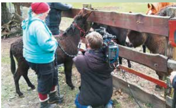
Mogli ist die Attraktion auf dem Tierschutzhof

Sein persönlicher Liebling ist aber unsere Pferdestute. Sie ist auch nicht sehr groß und erinnert ihn vielleicht an seine Partnerin, die wir auch gerne mit übernommen hätten. Jetzt lebt er ein glückliches Eselleben ist gesund und wir sind sehr dankbar ihm, und auch den anderen Bewohnern unseres Hofes, mit der tollen Unterstützung des Bund deutscher Tierfreunde, das ermöglichen zu können.