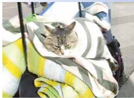
Das unendliche Leid des Krieges in der Ukraine trifft auch die Tiere

Tierschutz ist nicht nur eine Aufgabe in sonnigen Zeiten. Manchmal ist für Romantik kein Platz. In harten Zeiten wie heute ist zupacken gefragt. Probleme müssen beseitigt werden, Herausforderungen müssen bewältigt werden. Und dabei darf der Alltag nicht vergessen werden. Den Hunde, Katzen, Pferden und Kleintieren in den Tierherbergen ist es egal, ob Corona tobt oder ein Krieg. Sie wollen und müssen versorgt werden. Eine Doppelbelastung für Tierschutzvereine, die auf der einen Seite die tägliche Routine bewältigen müssen (und die ist oft schon schwer zu ertragen) und auf der anderen Seite noch die besonderen Aufgaben der großen Krise in Angriff nehmen müssen.