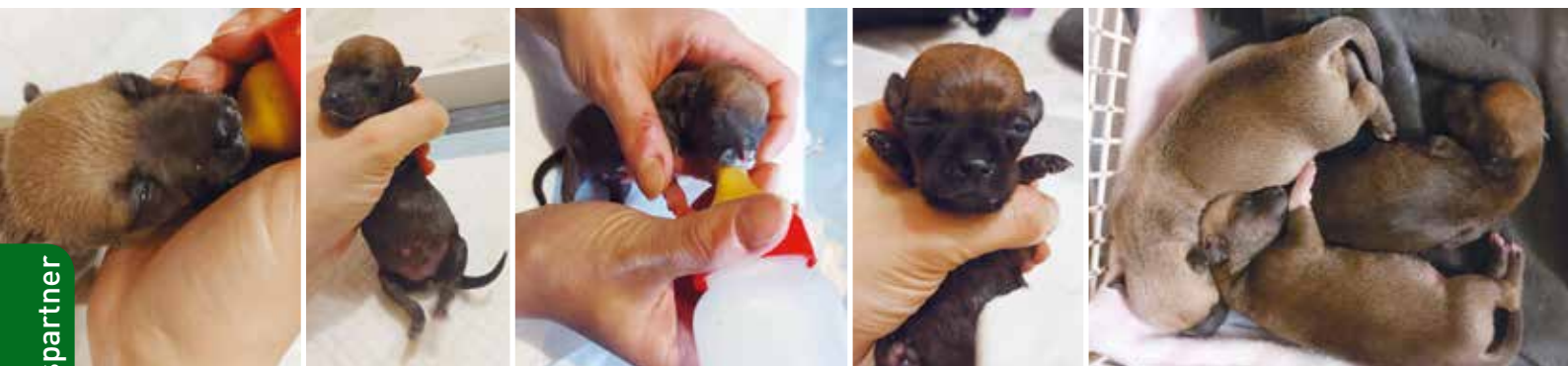
Die Winzlinge müssen aufgefäpelt werden

Tierschutz mit Herz – das ist einer der Schwerpunkte der Arbeit der Tierschützer vom Welpenwaisenhaus NRW e.V. in Nettersheim-Tondorf. Und die Tierschützer vor Ort sind unermüdlich im Einsatz – auch an Feiertagen. Hier schildern sie mit eigenen Worten die Erlebnisse am vergangenen Weihnachtsfest. Ein typisches Beispiel für den Kampf um jedes kleine Tierleben.