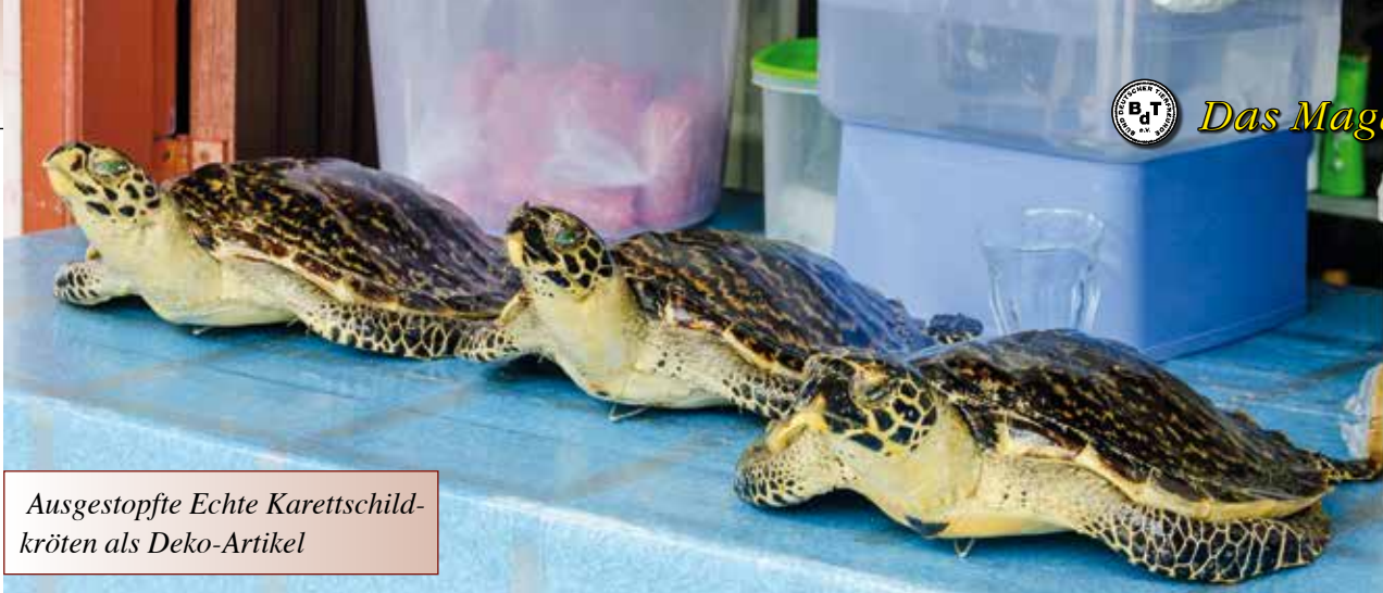
Ausgestopfte Echte Karettschildkröten als Deko-Artikel

Heute werden Objekte dieser Art meist aus Plastik hergestellt, aber das Aussehen imitiert manchmal noch die getigerte oder geflammte Optik von Schildpatt mit seinen leuchtenden orangefarbenen und roten Akzenten. Viele Menschen in Deutschland wissen heutzutage gar nicht mehr, was Schildpatt eigentlich ist, oder verwechseln es mit Perlmutter. Nur in Omas Schmuckschatulle findet man vielleicht hier und da noch einen Ring oder Armreif aus dem exotischen Material.