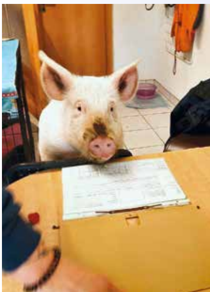
Auch im Büro fühlt er sich sehr wohl