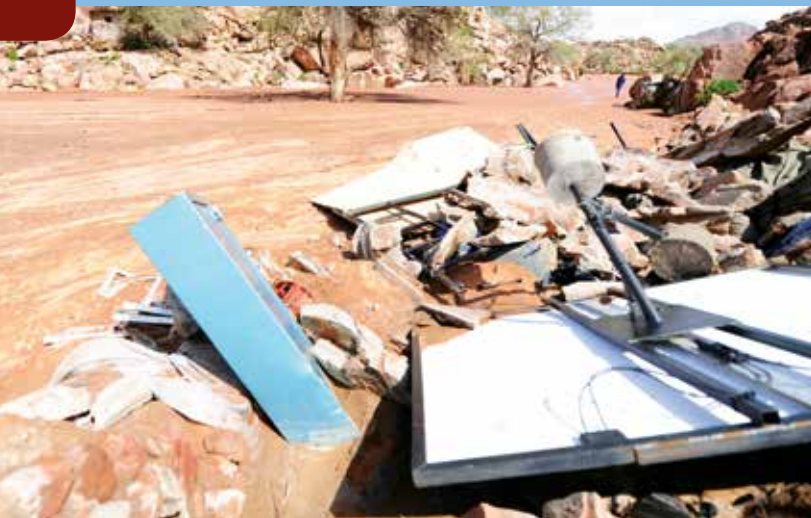
Trotz der Wassermassen gab es keine Verletzten