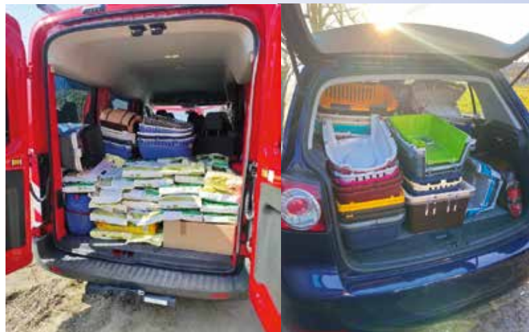
Ein Wagen voll Transportboxen – Paletten mit Hunde- und Katzenfutter für die Tiere in der Ukraine – Wagen voller Zukunft für Tiere