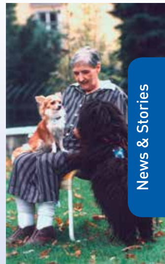
Hunde sind ein wahrer Jungbrunnen