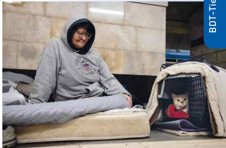
Die Flucht mit dem geliebten Haustier