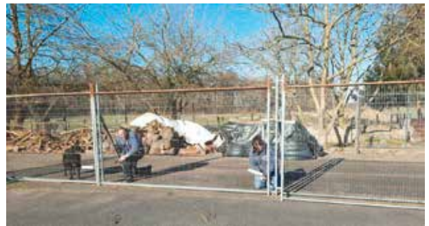
Die Bauarbeiten sind noch nicht abgeschlossen

aufrecht stehend aneinander geschraubt, mit Ein- und Ausgängen versehen und mit Erde gefüllt. So können die Langohren nach Herzenslust buddeln und wühlen ohne „verloren“ zu gehen. Auf mehreren kleinen Stellen wird es Wiesenflächen geben, damit sie dort ihren natürlichen Bedürfnissen nachgehen können. Abgerundet wird das Ganze von Häuschen, Hütten, Tunneln und Ebenen, sodass wirklich jeder neue kleine Bewohner auf seine Kosten kommt.